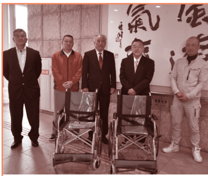
福岡県立行橋高等学校明豊会・・・車椅子2台をご寄付いただきました。