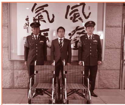
防衛省陸上自衛隊小倉駐屯地曹友会・・・車椅子2台をご寄付いただきました。