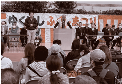
令和5年度 ゆくはしふくしまつり開会式の様子